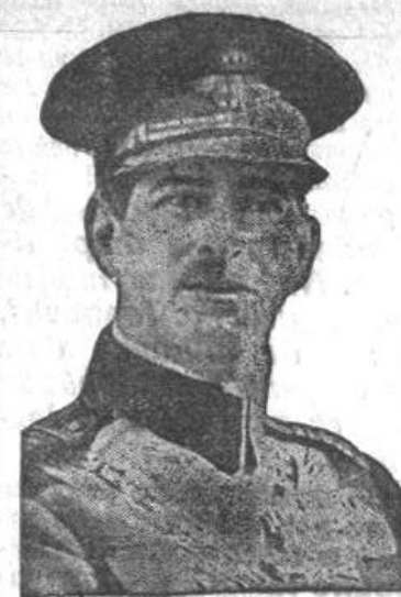
M. S. Regele CAROL II

În interior, conducătorii Muzeului Militar, au expus câte-