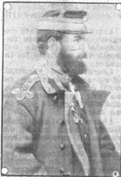
Regele CAROL I

către municipalitate ca un omagiu adus Dinastiei Române, dela a cărei întemeiere se împlinesc în această primăvară 70 de ani.