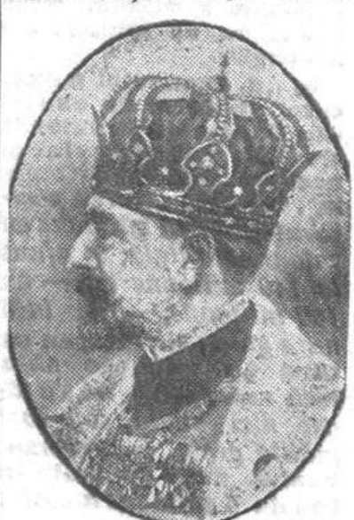
Regele FERDINAND I

Dela suirea pe tron a M. S. Regelui Carol II și până acum, s'a dat o deosebită atenție armatei, culturii, cercetășiei și urbanistice, așa că despre ele se